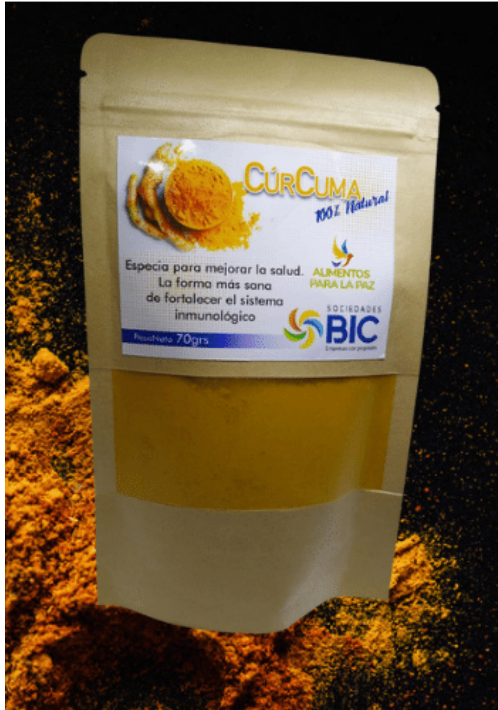
Curcuma 100% pura, por 70 g.. $15.000