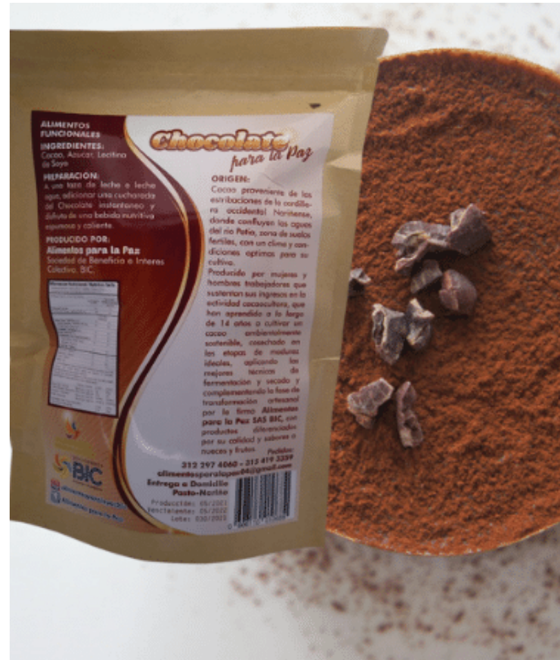
Chocolate semiamargo instantáneo 55%, por 454 g. $12.000