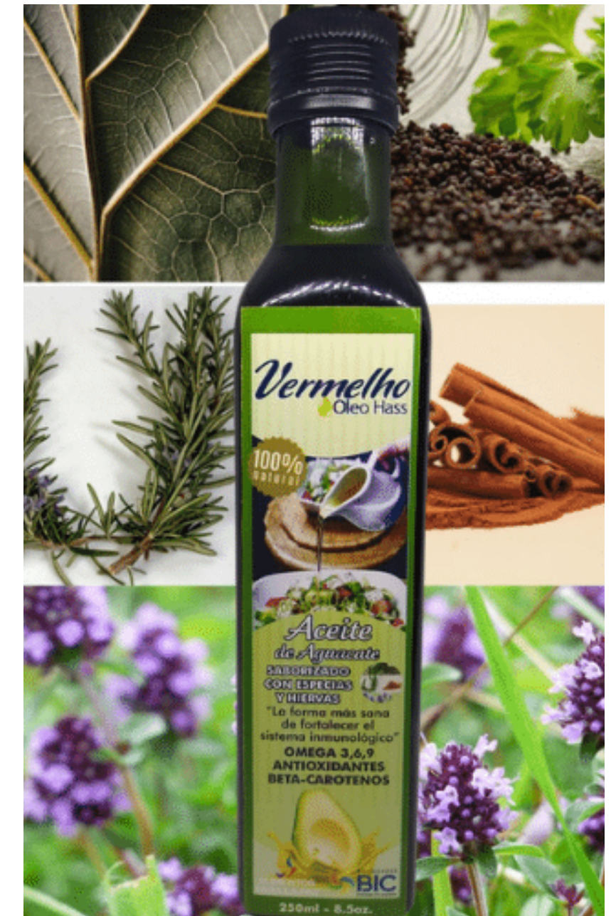
Aceite de finas hiervas y especias, por 250 mi. $ 35.000