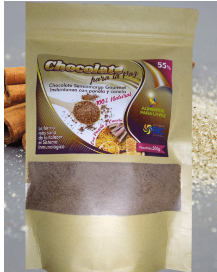
Chocolate semiamargo instantáneo panela +canela, por 454 g. $ 15.000