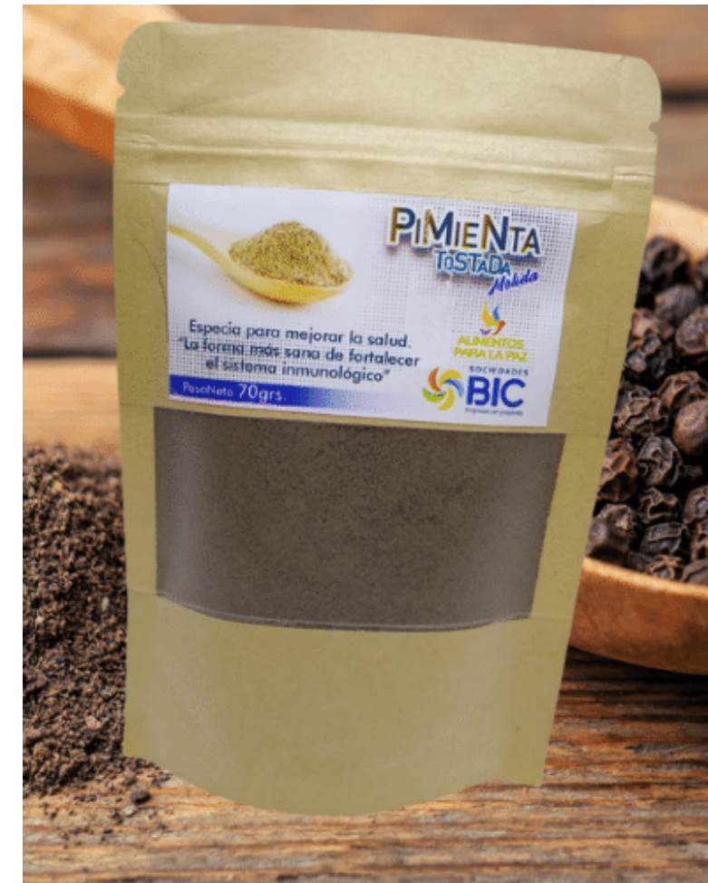
Pimienta negra molida 100% pura por 70 g. $ 12.000