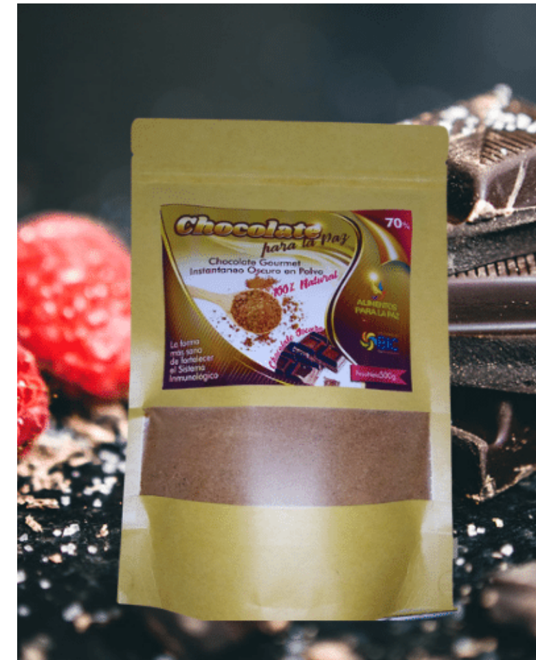
Chocolate negro 70%, por 454 g. $ 25.000