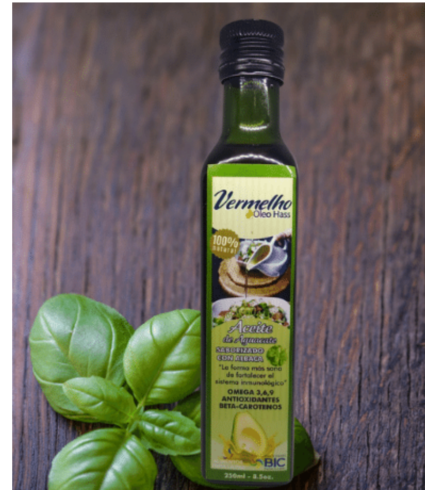
Aceite de aguacate saborizado con albahaca. por 250 ml $ 32.000