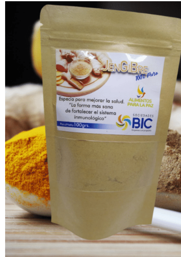
Jengibre 100% puro, por 100 g. $12.000