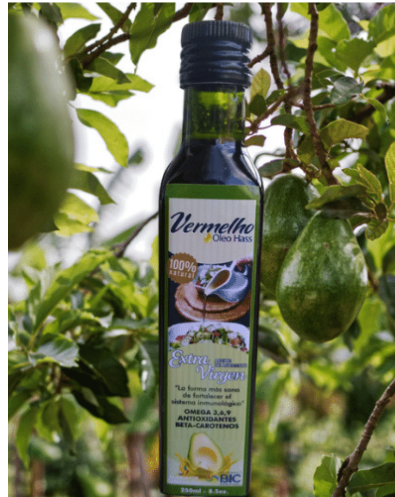
Aceite de aguacate virgen extra, por 250 ml. $32.000