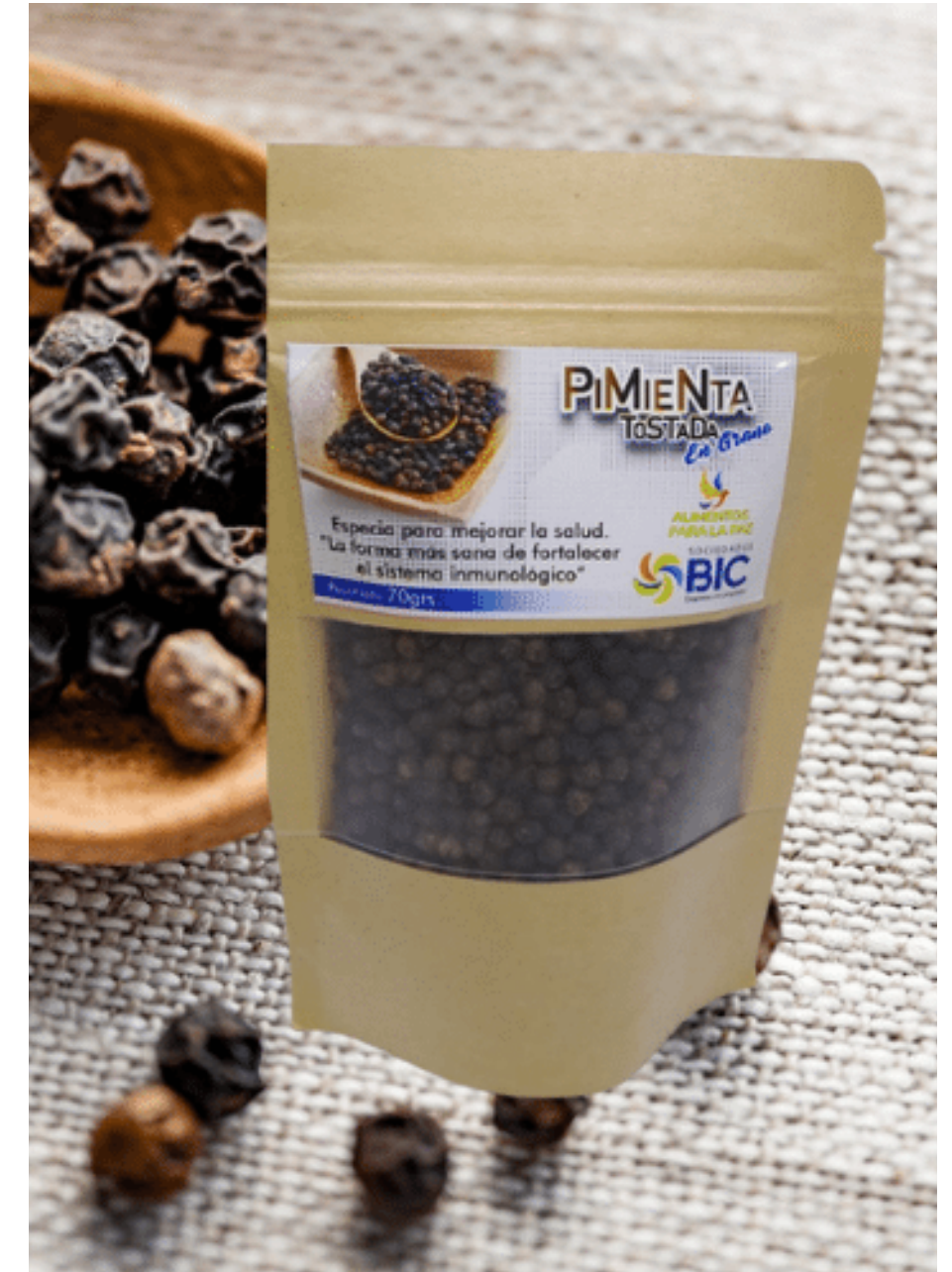
Pimienta negra, en pepa 100%, por 70 g.. $ 10.000