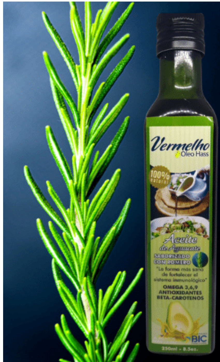
Aceite de aguacate con romero, por 250 ml. $32.000